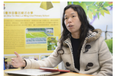
文主任深知推廣 BYOD 的同時一定需要同步部署流動裝置管理方案，建立系統的管理模式，嚴格確保每位學生遵守正確的使用規範

文主任自身擁有豐富的 IT 分析和管理的經驗，深知在推廣 BYOD 的同時一定需要同步部署 MDM (Mobile Device Management, 流動裝置管理) 方案。在對比了坊間多家廠商的公司背景及解決方案後，決定採用 VMware 旗下的 AirWatch 首先建立了學校自身獨有的 Enterprise App Store，取名為 Treasure Island，並上載了逾 100 款為各個科目自主開發的學習應用程式。並同時隱藏了商用的 App Store 以防止學生存取其他應用程式以作娛樂用途。此外，透過部署 AirWatch 的 MDM 解決方案，建立了系統的管理模式，嚴格確保每一位學生都有遵守正確的使用規範。